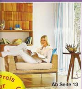
Ab Seite 13

Nr. 2/2010 Deutschland 2,20 € | Österreich 2,50 € Schweiz 4,30 SFR | Benelux 2,50 € | Frankreich 2,50 € Italien 2,50 € | Slowenien 2,90 €