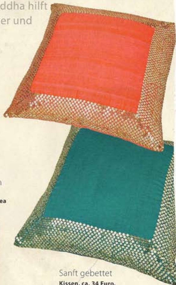
Sanft gebettet Kissen, ca. 34 Euro, von Debenhams