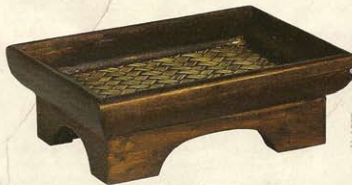
Kleiner Altar Standtablett, ca. 6 Euro, von Kokon