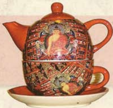
Sinnlicher Genuss Teeset, ca. 24 Euro, von Jameson Taylor

Ein Moment der Einkehr bereichert jeden Tag, auch wenn es nur ein kurzes Augenschließen und Tiefdurchatmen ist. Die friedvolle und beruhigende Aura des Buddha hilft dabei, den Geist zu reinigen und sich auf das Hier und Jetzt einzulassen.