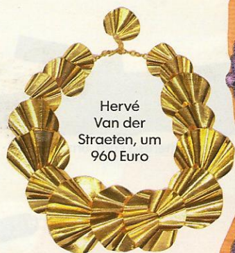
Hervé Van der Straeten, um 960 Euro