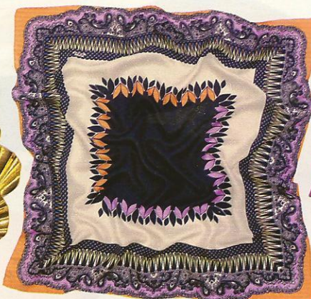
Etro, um 110 Euro