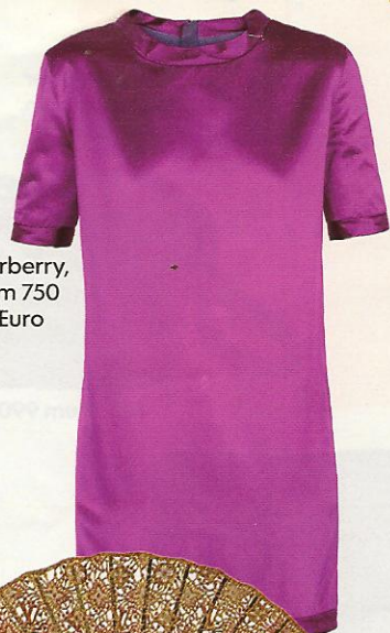
Burberry, um 750 Euro