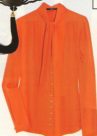
Gucci, um 600 Euro