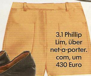
3.1 Phillip Lim, über net-a-porter.com, um 430 Euro