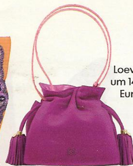
Loewe, um 1400 Euro