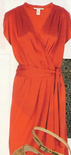
Diane von Furstenberg, um 390 Euro