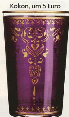
Kokon, um 5 Euro